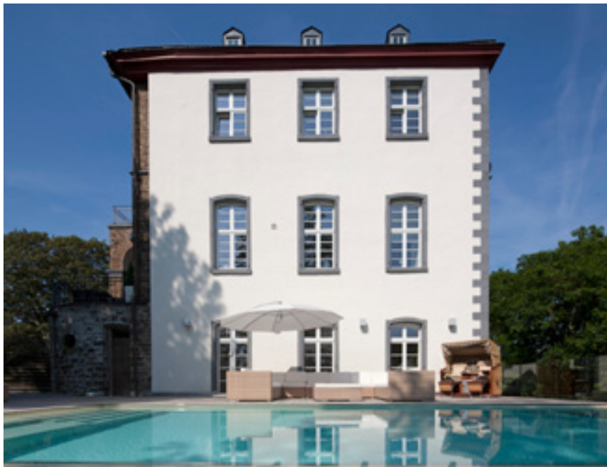
Das alte Schloss wurde vorsichtig nach den Maßgaben des Denkmalschutzes saniert und modernisiert und durch die Terrasse und eine Poolanlage ergänzt, die farblich und architektonisch gut zusammenpassen.

Um den Eindruck eines schwebenden Pools noch zu verstärken, plante Michael Blechschmidt zusammen mit dem ausführenden Architekturbüro RMK-Bauplanung an drei Seiten des 10 x 4,50 m großen Beckens einen freien Überlauf, über den das Wasser in einer Kaskade an der Beckenwand abläuft, um dann in einer mit Gefälle angebrachten Überlaufrinne gesammelt und